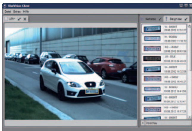
Erkannte Kennzeichen im KiwiVision® VMS dargestellt